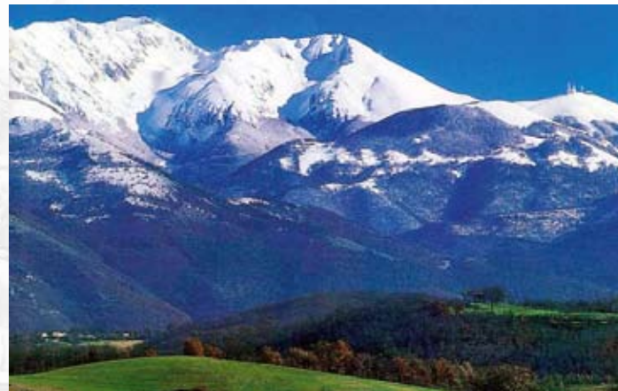
Terminillo (2.216 m) - Lazio