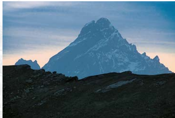
Monviso (3.841 m) - Piemonte