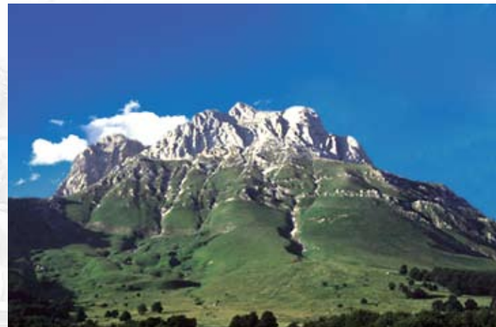
Gran Sasso (2.912 m) - Abruzzo