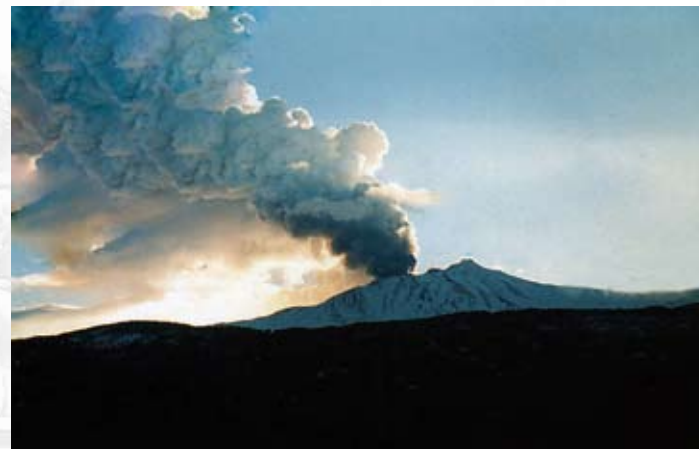
Etna (3.340) - Sicilia