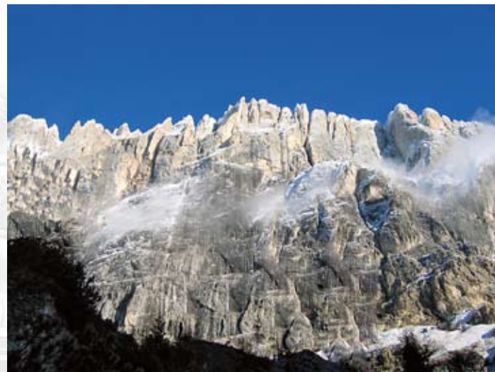
Marmolada (3.342 m) - Veneto