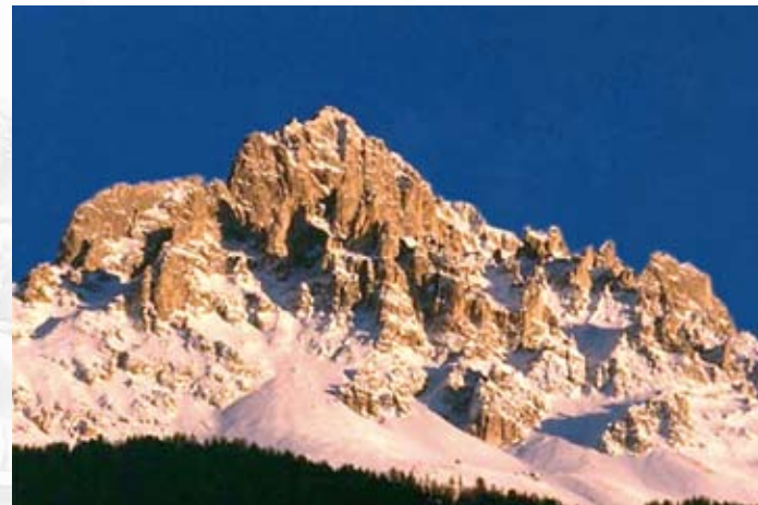
Catinaccio (3.002 m) - Trentino Alto Adige