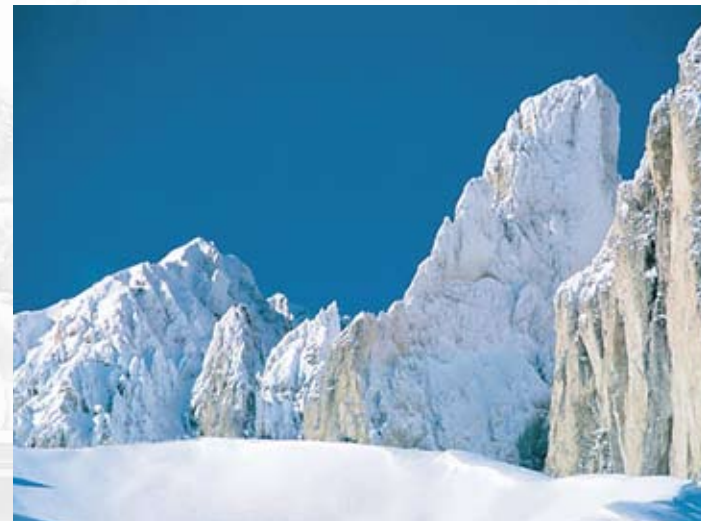
Sassolungo (3.181 m) - Trentino Alto Adige