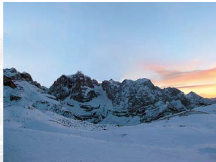
Adamello (3.539 m) - Lombardia