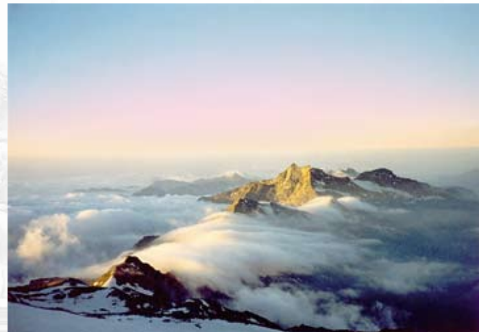
Monte Rosa (4.634 m) - Valle d'Aosta