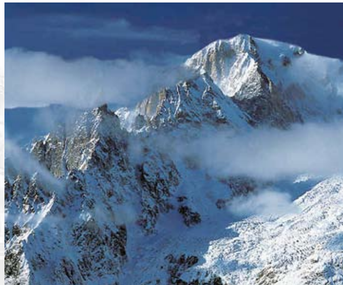
Monte Bianco (4.810 m) - Valle d'Aosta